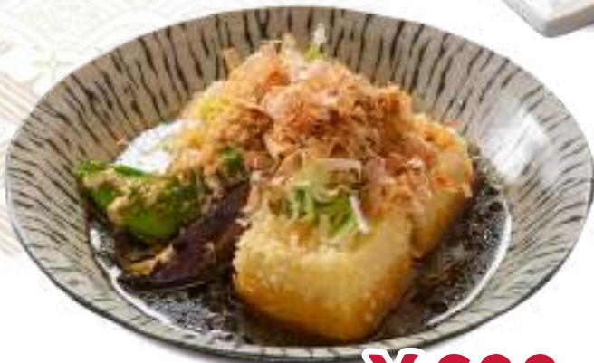
揚げだし豆腐 ¥600 (税込 ¥660)