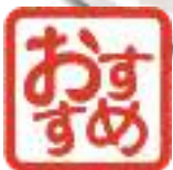
若鶏唐揚げ ¥900 (税込 ¥990)