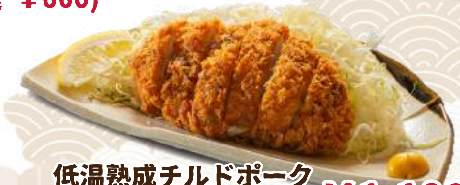
低温熟成チルドポーク 厚切り豚カツ ¥1,180 (税込 ¥1,298)