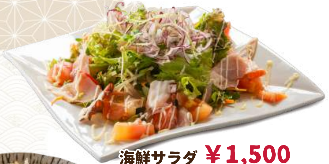
海鮮サラダ ¥1,500 (税込 ¥1,650)